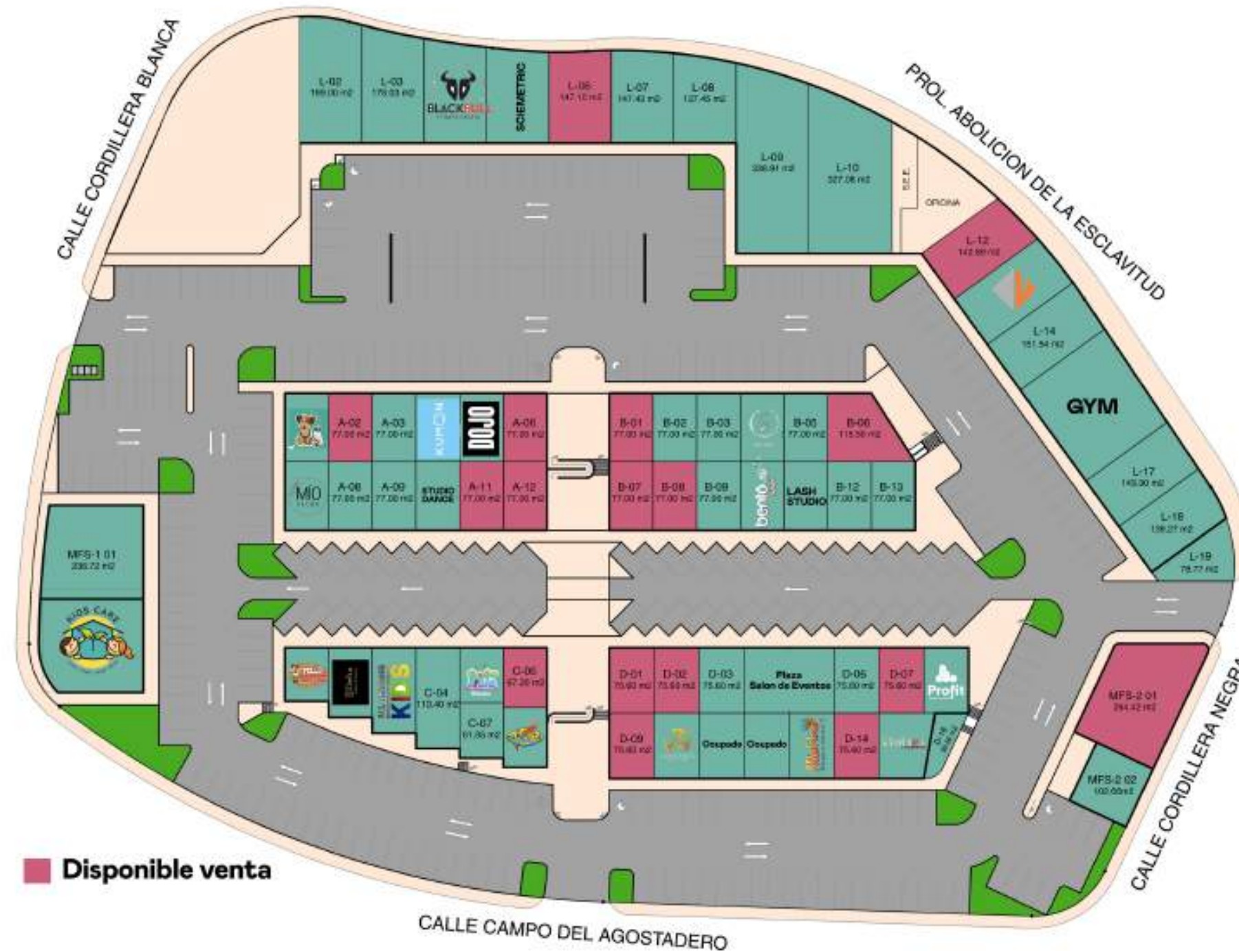
PASEO BASARÍ PLAZA COMERCIAL

Locales desde $21,000 el m2 +IVA (calculado sobre el 58% del total)